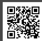
3D PUTTER MAT